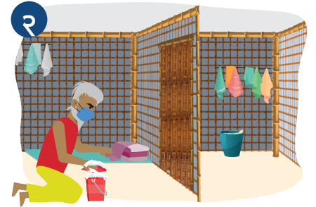
၃ တစ်ကိုယ်တည်းသီးခြား နေသောသူသည် သူ့ အခန်းကို သူ့ကိုယ်တိုင် သန့်ရှင်းရေးလုပ်ပါ။