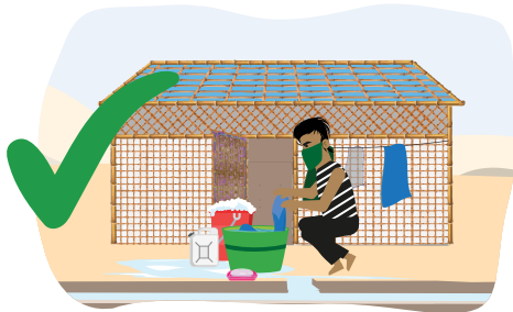
၁၁ ပလက်စတစ်ကို သင်ခိုလှုံနေထိုင်ရာနေရာမှာ ပြင်မက် ရေစီးနေသောရေရာတွင် လျှော်ဖွတ်ပါ။ အဝတ်ချို့ ဆပ်ပြာရည်ဖြင့် ချိုးပြီးနောက် ပလက်စတစ်အခင်းကို သင်ခိုလှုံနေထိုင်ရာ ပြင်မက်နေထိုင်တွင်လှန်းပါ။