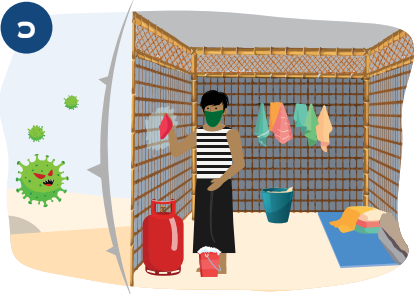
၁ သင် ခိုလှုံ နေထိုင်ရာကို သန့်ရှင်းစွာထားခြင်းသည် ရောဂါပိုး မပြန့်ပွားရန် ကူညီရာ ရောက်သည်။