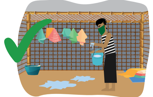
၉ သင်သည် မြေအခင်းတွင် နေထိုင်သူဖြစ်ပါက မုန့်ခါပြီး သန့်ရှင်းမလုပ်ပါနှင့်။ မြေအခင်းကို ရေ အနည်းငယ် ပက်ဖြန်းပြီး အဝတ်စ(သို့) ပြုတ်ကို ရေဆွတ်ပြီး ပုံများ မထရအောင် မြေပြေးချင်း သုတ်ယူပါ ထိုနောက်အခန်းကို ရေခြောက်သွေ့အောင်ထားပါ။