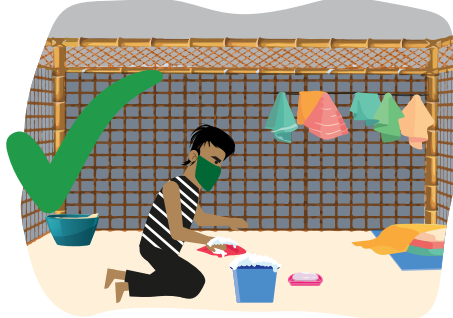
၈ သင်သည် သမံတလင်းအခင်းတွင် နေထိုင်သူ ဖြစ်ပါက မုန့်ခါပြီး သန့်ရှင်းမလုပ်ပါနှင့်။ ရေပဲတစ် လုံးတွင် အဝတ်လျှော် ဆပ်ပြာ နှင့် ရေရောစပ်ပြီး သမံတလင်းကို ရေဖြန်းပါ ထိုနောက် အဝတ်စ(သို့) ပြုတ်ဖြင့်သန့်ရှင်းရေးလုပ်ပါ ပြီးလျှင် အခန်းကိုခြောက်သွေ့အောင်ထားပါ။