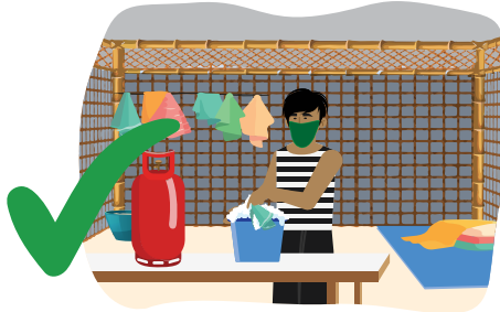
၅ သင် ခိုလှုံနေထိုင်ရာ အခန်းကြမ်းပြင်ကို သန့်ရှင်းရေးလုပ်မည်ဆိုပါက အဝတ်ကို ဆပ်ပြာရည်ဖြင့် ဆွတ်ပြီးမှ သန့်ရှင်းရေးလုပ်ပါ။