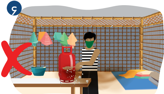
၄ သင် ခိုလှုံနေထိုင်ရာ အခန်းမှ အမှိုက်များကို ခြောက်သွေ့ သောအဝတ်အသုံးပြု၍ သန့်ရှင်းရေး မလုပ်ပါနှင့်။ အကယ်၍ ရောဂါပိုးသည် မျက်နှာပြင်ပေါ် ရောက်နေပါက သင့်ကူးပြန့်နိုင်ပါသည်။