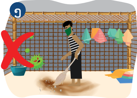
၇ သင် ခိုလှုံနေထိုင်ရာ အခန်းတွင် အမှိုက်များကို ခြောက်သွေ့ သောအဝတ်အသုံးပြု၍ မုန့်ခါပြီး သန့်ရှင်းမလုပ်ပါနှင့်။ လုပ်ပါက ကူးပြန့်နိုင်ပါသည်။