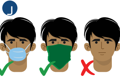
၂ သင် ခိုလှုံနေထိုင်ရာကို သန့်ရှင်းရေး မလုပ်မီ နှာခေါင်း နှင့် ပါးစပ်ကို မျက်နှာဖုံးအုပ်ထားပါ။