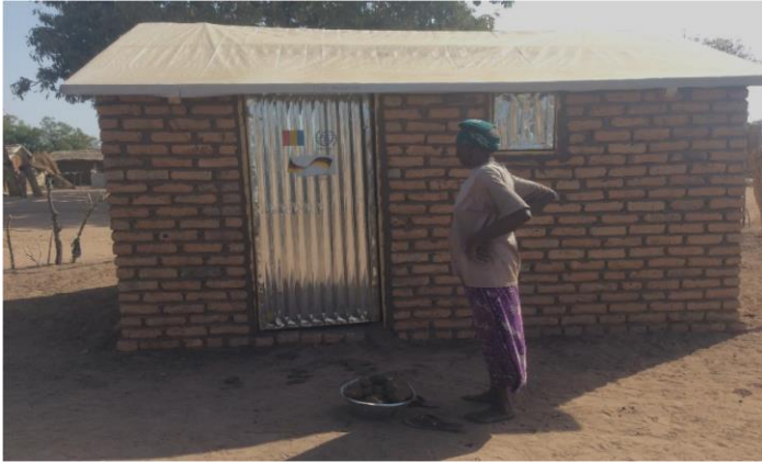
Photo d'un abri semi-durable construit par IOM dans le Sud