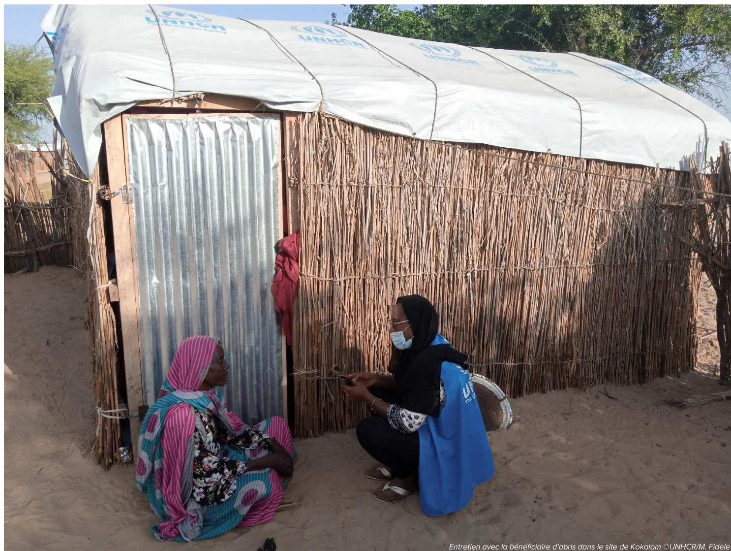
Entretien avec la bénéficiaire d'abris dans le site de Kokolom