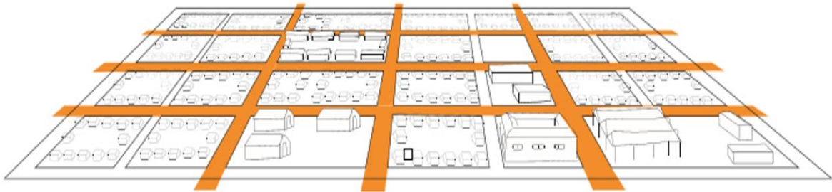
صورة رقم ١: يمكن إتاحة وصول سيارات الطوارئ من خلال نظام شبكي بسيط.

يجب تقييم مخاطر الحرائق للاسترشاد به في تخطيط المواقع للمستوطنات المجتمعية المؤقتة ودمج وحدات إيواء الأسر المنفردة. يجب أن تتضمن إجراءات التخفيف توفير مساحات عازلة للحماية من الحرائق بطول 30 متر بين كل 300 متر من المساحة المبنية، ومترين على الأقل (بل ويفضل ضعف الارتفاع الكلي لأي هيكل) بين المباني أو وحدات المأوى المنفردة لمنع الهياكل المنهارة من ملامسة وحدة المأوى المجاورة. يجب الحفاظ على المساحات العازلة للحماية من الحرائق خالية من تعديلات المباني والشجيرات لمنع انتشار الحرائق.