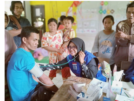
Foto kegiatan lembaga

Untuk registrasi kegiatan lembaga, silahkan mengisi form berikut: http://bit.ly/form3wshelterselatsunda