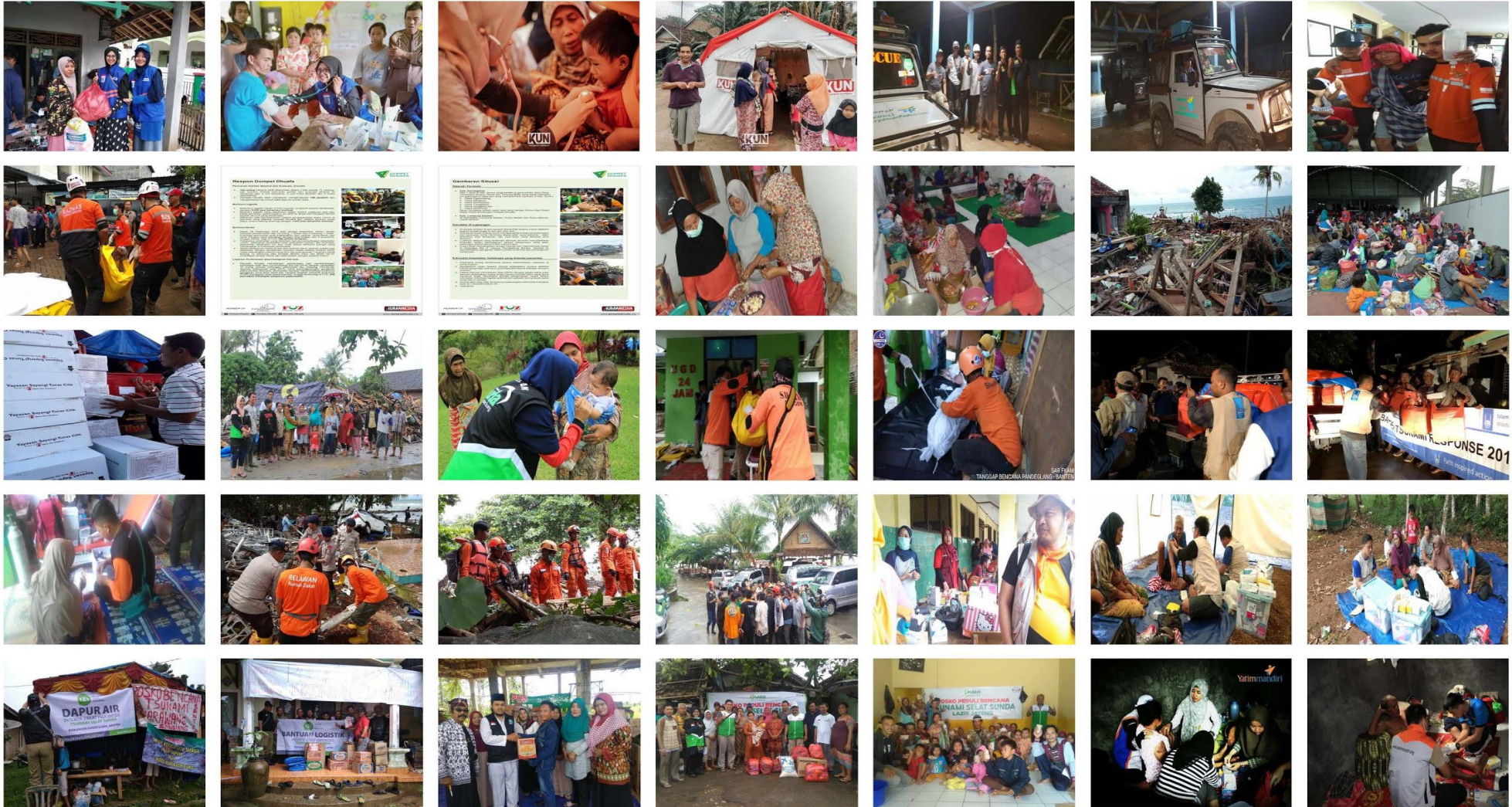
Foto kegiatan lembaga

Untuk registrasi kegiatan lembaga, silahkan mengisi form berikut: http://bit.ly/form3wshelterselatsunda