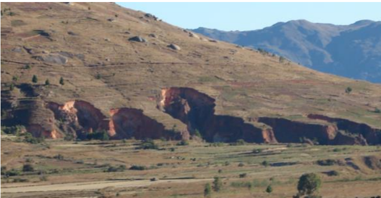
Les Lavaka sont des glissements de terrain dus à l'érosion des sols, ici dans les Hauts Plateaux