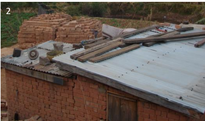
Maisons à 1 : Antsirabe ; 2 : Antananarivo