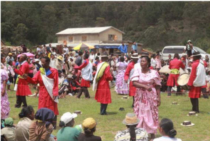
Spectacles de sensibilisation aux problèmes sanitaires