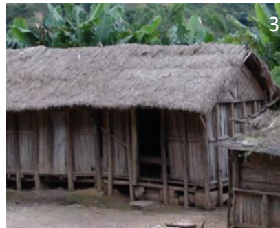
1 et 2 : Maisons sur les hauts plateaux ; 3 : Maison entre Fianarantsoa et Manakara © E. Crété, 2007