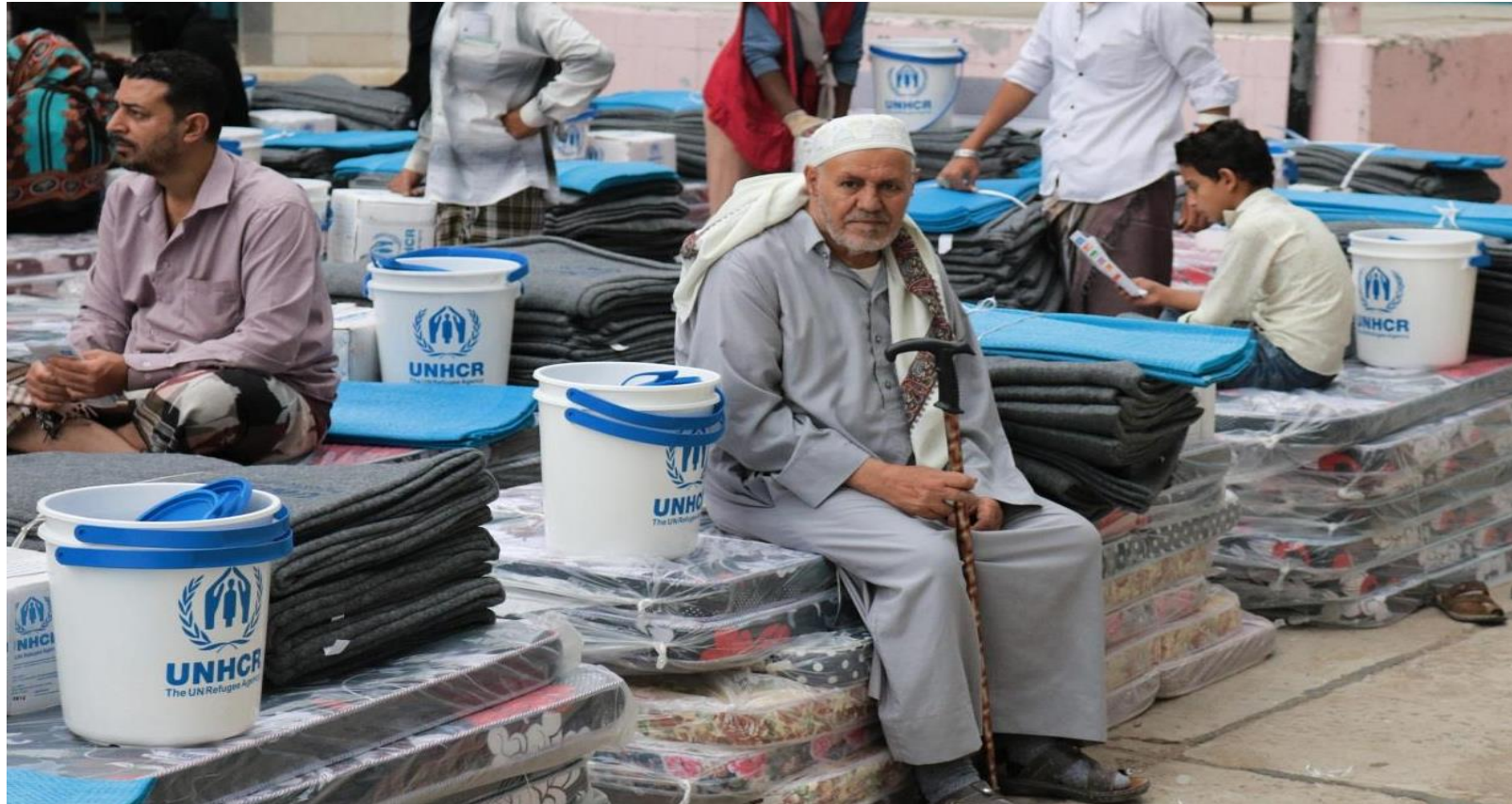
توزيع مواد غير غذائية من قبل جمعية الأمان لرعاية الكفيفات في مديرية ذي السفال، محافظة إب.