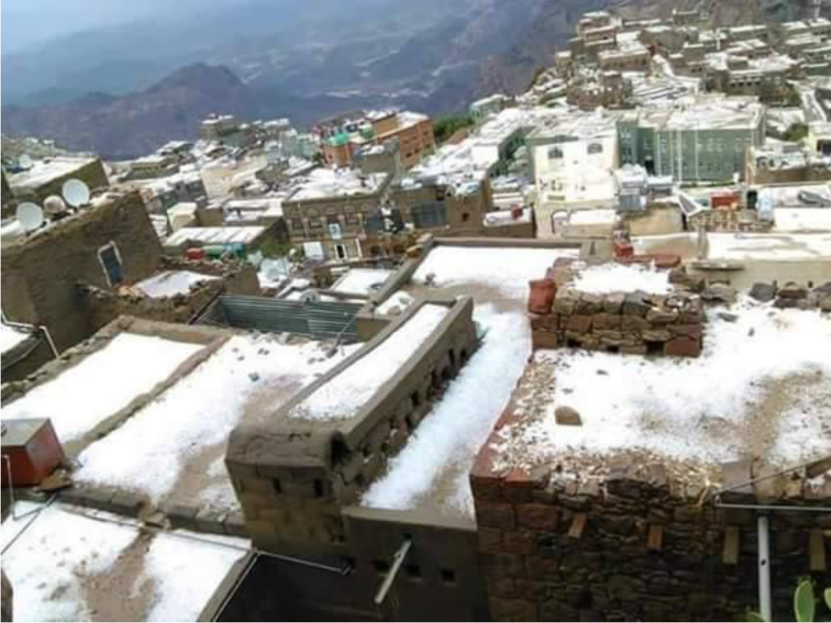
تساقط الثلوج في منطقة حراز بمديرية مناخة بمحافظة صنعاء.