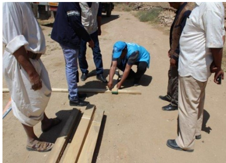
تركيب حزمه الماوى الطارئ المحسن

ومن ناحية أخرى، وتماشيا مع استراتيجية الكتلة وتقديم عدة الماوى الطارئ المحسنة الجديدة، والتي يتم تنظيم دورات تدريبية بخصوصها للشركاء في محافظات التي يتم التنفيذ فيها. في شهر أكتوبر، تلقى شركاء الكتلة في صعدة تدريباً حول كيفية تركيب الحزم الجديدة التي تم تصميمها لتغطية مساحة 15 متر مربع مع حجم 37.5 متر مكعب، وهو تحسن هام مقارنة بالمعيار المقدم من قبل.