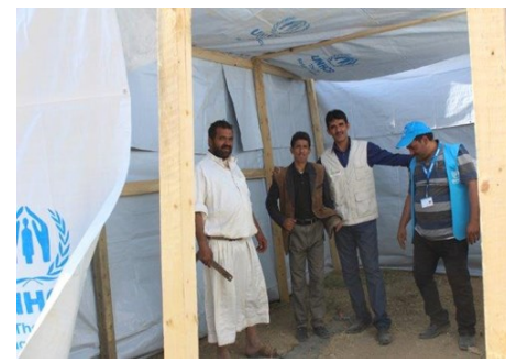
الشركاء في صعدة خلال التدريب