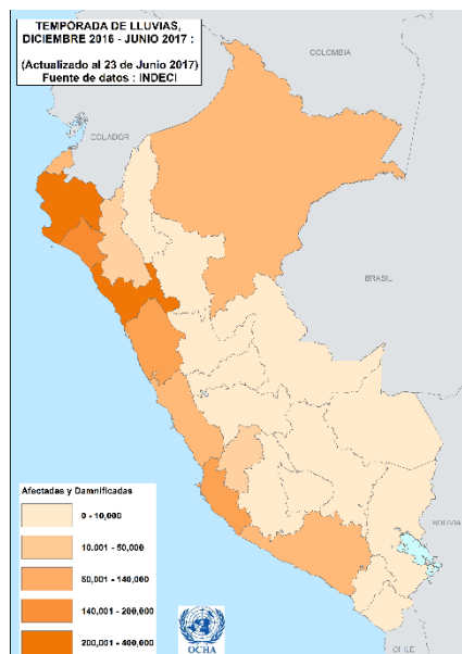
Mapa: cantidad de afectados y damnificados