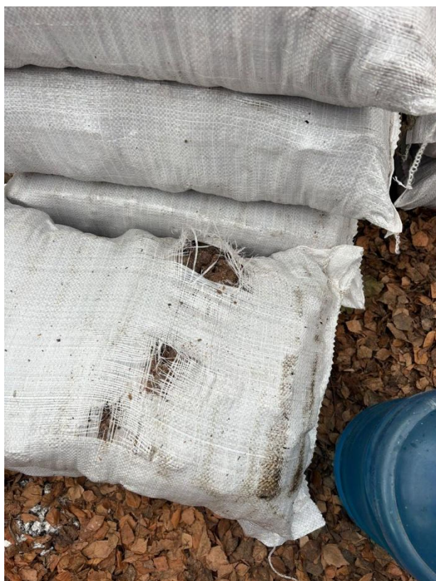
Фото 2–3. Брикети з лушпиння соняшника: крупний план; пошкоджені брикети всередині мішка