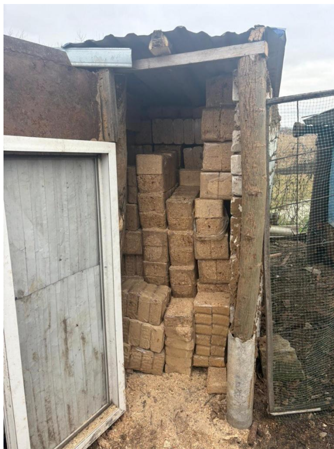
Фото 4. Складені деревні брикети

Одне домогосподарство, яке отримало брикети з лушпиння соняшника, повідомило про неприємний запах палива, тоді як інші бенефіціари, які отримали брикети від того ж постачальника, не зазначали такої проблеми. Відтак для формування обґрунтованих висновків щодо цього