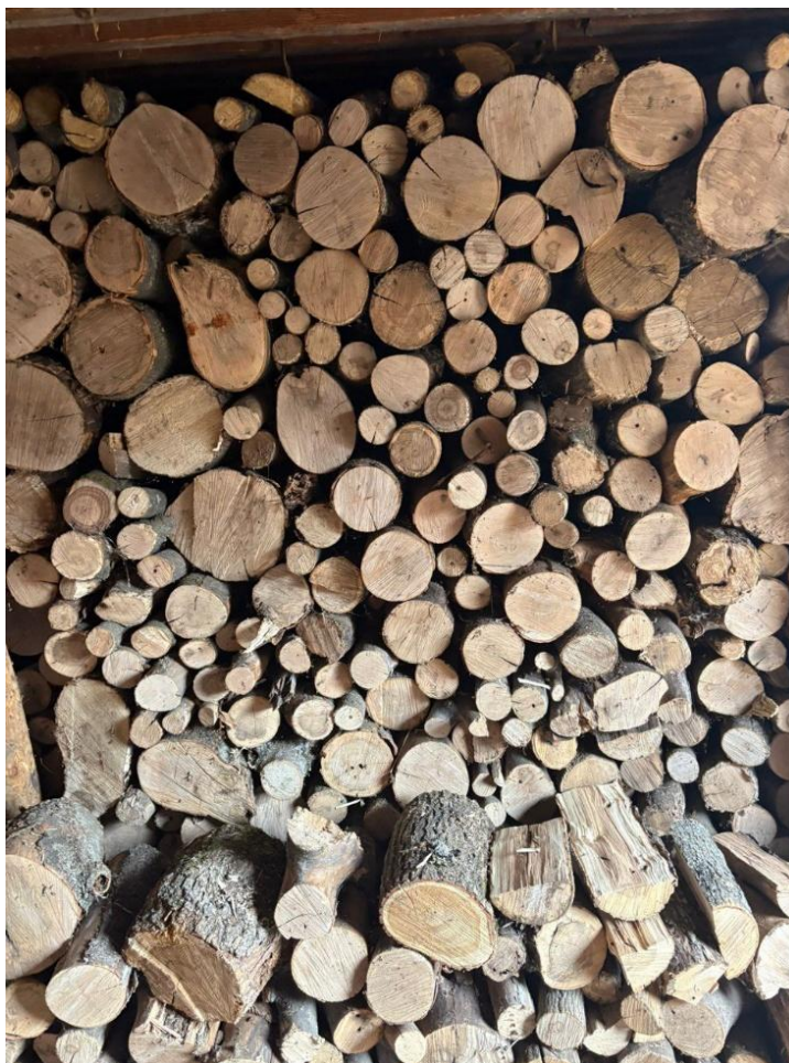
Фото 1. Дрова, самостійно придбані бенефіціаром

Один бенефіціар, який очікував отримати 3,44 тонни брикетів, повідомив, що у жовтні отримав лише одну тонну — першу партію. Отримана допомога була використана протягом приблизно одного місяця, і на момент моніторингового візиту домогосподарство вже близько місяця повністю використовувало дрова, придбані за власні кошти. Хоча спочатку організація повідомляла, що решта допомоги буде надана