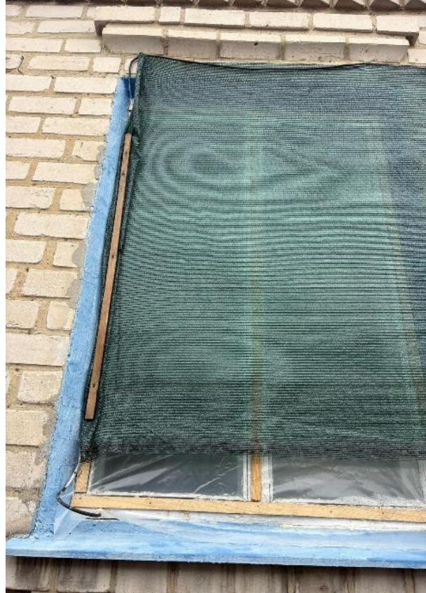
Фото 6. Отримувач 2 тонн брикетів використовує поліетиленову плівку та сітку для утеплення вікон приватного будинку.

Зазначені домогосподарства включали як отримувачів 3,44 тонн брикетів, так і домогосподарства, які отримали 2 тонни, а також ті, що мали або не мали додаткових