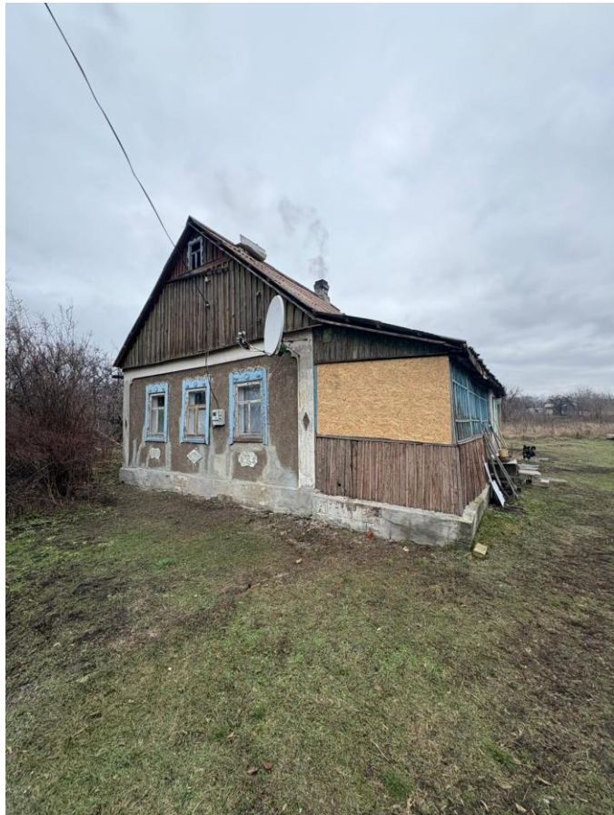
Фото 5. Дим із димоходу приватного будинку під час використання твердого палива

Одне домогосподарство придбало дрова, що залишалися у сусідки, яка виїжджала з населеного пункту через пошкодження житла, на загальну суму 15 000 грн. Бенефіціарка не змогла точно вказати обсяг придбаних дров, однак зазначила, що за умови поєднання з наявними запасами вугілля обсяг палива мав бути достатнім. Представник органу місцевої влади, присутній під час обговорення цього питання, зазначив, що така практика є поширеною серед домогосподарств, які самостійно евакуюються та раніше придбали тверде паливо, але більше не планують його використовувати, у зв'язку з чим продають залишки іншим мешканцям. Інші партнери під час моніторингового візиту також повідомили, що отримували подібні звернення через гарячу лінію. Водночас не було можливості