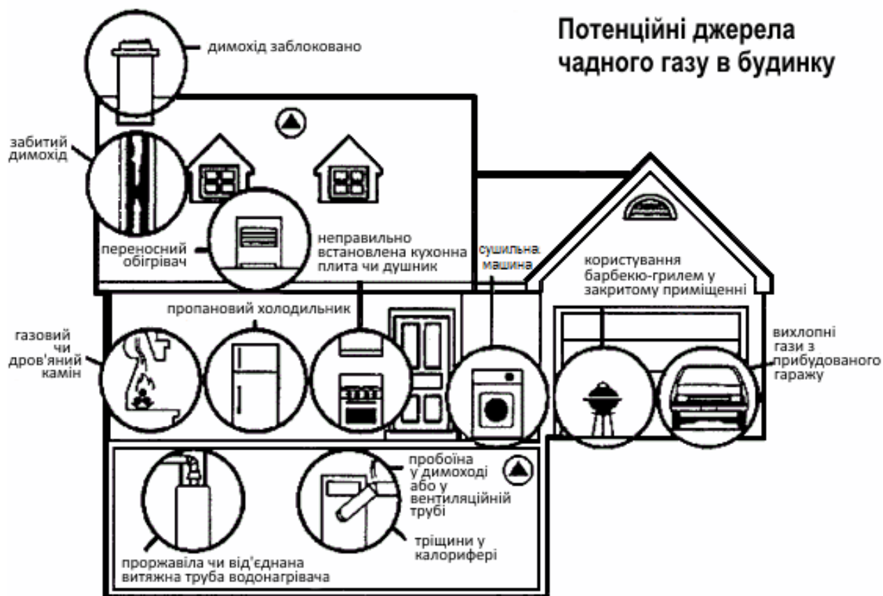
Мал. 1 https://www.irvingenergy.ca/wp-content/uploads/2010/11/carbon_monoxide_image.gif

Чадний газ або монооксид вуглецю - це газ, який утворюється при роботі з піччю, і є токсичним у певних концентраціях. Партнери, які надають печі в якості допомоги, повинні переконатися, що бенефіціари знають про небезпеку та проінструктовані щодо безпечного користування.