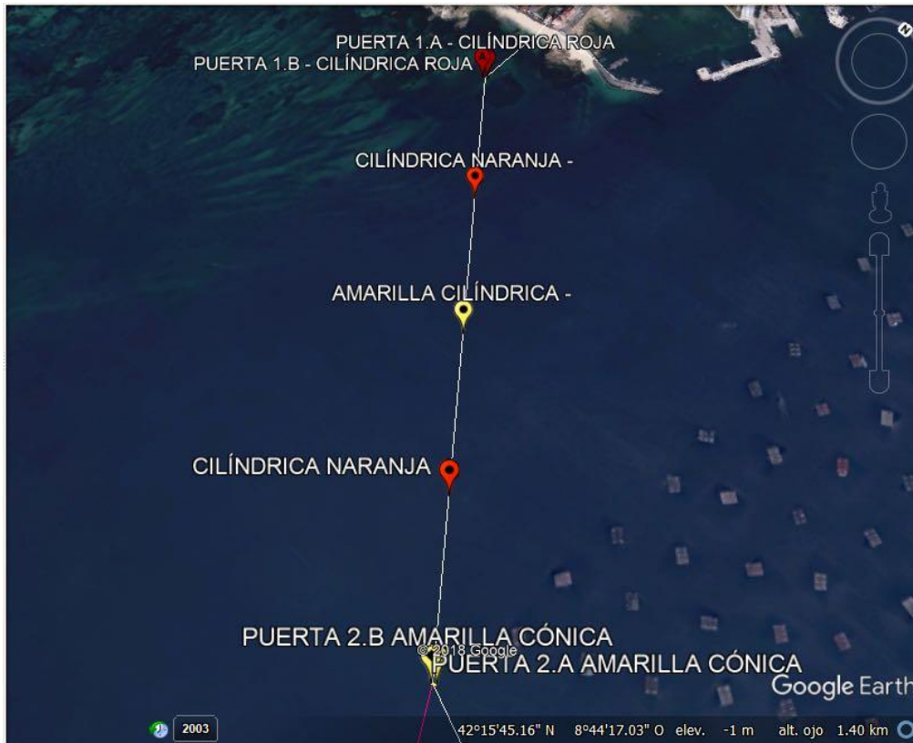
Tramo 1 común