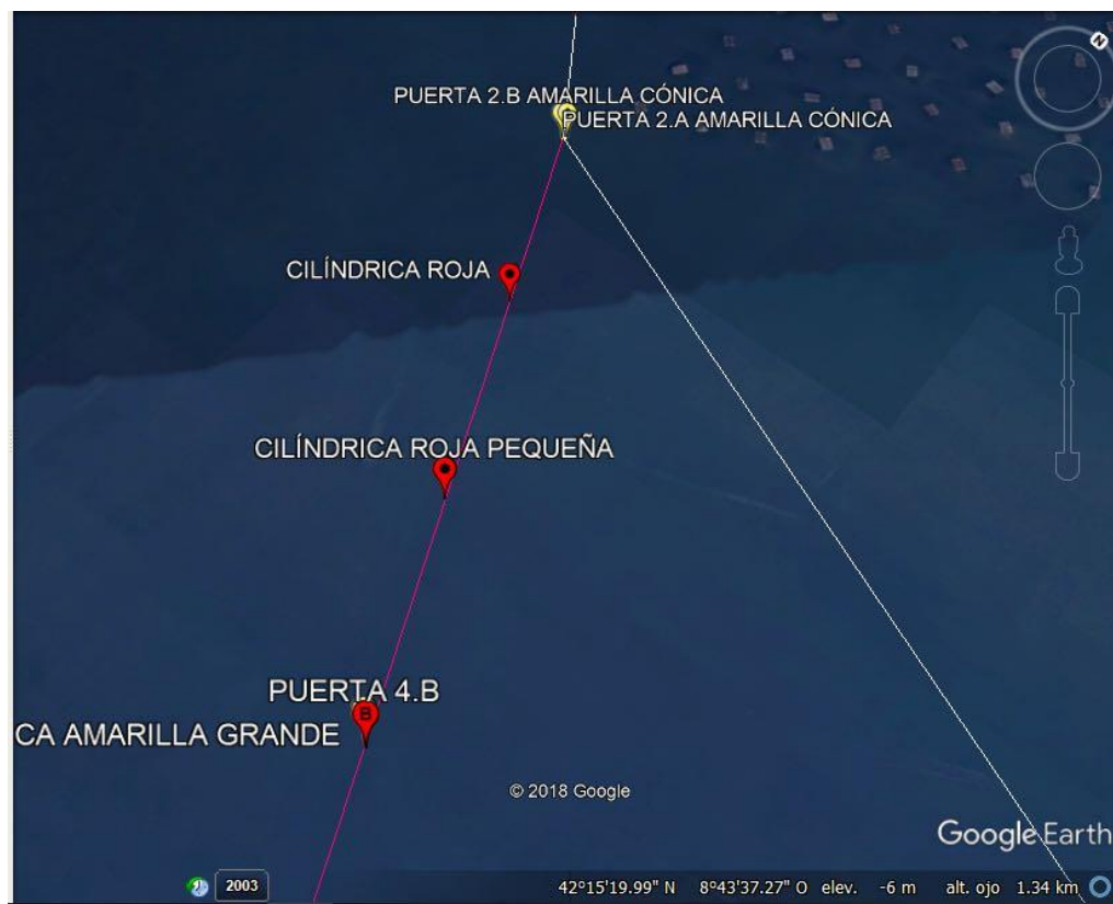
Tramo 2 Categoría 3