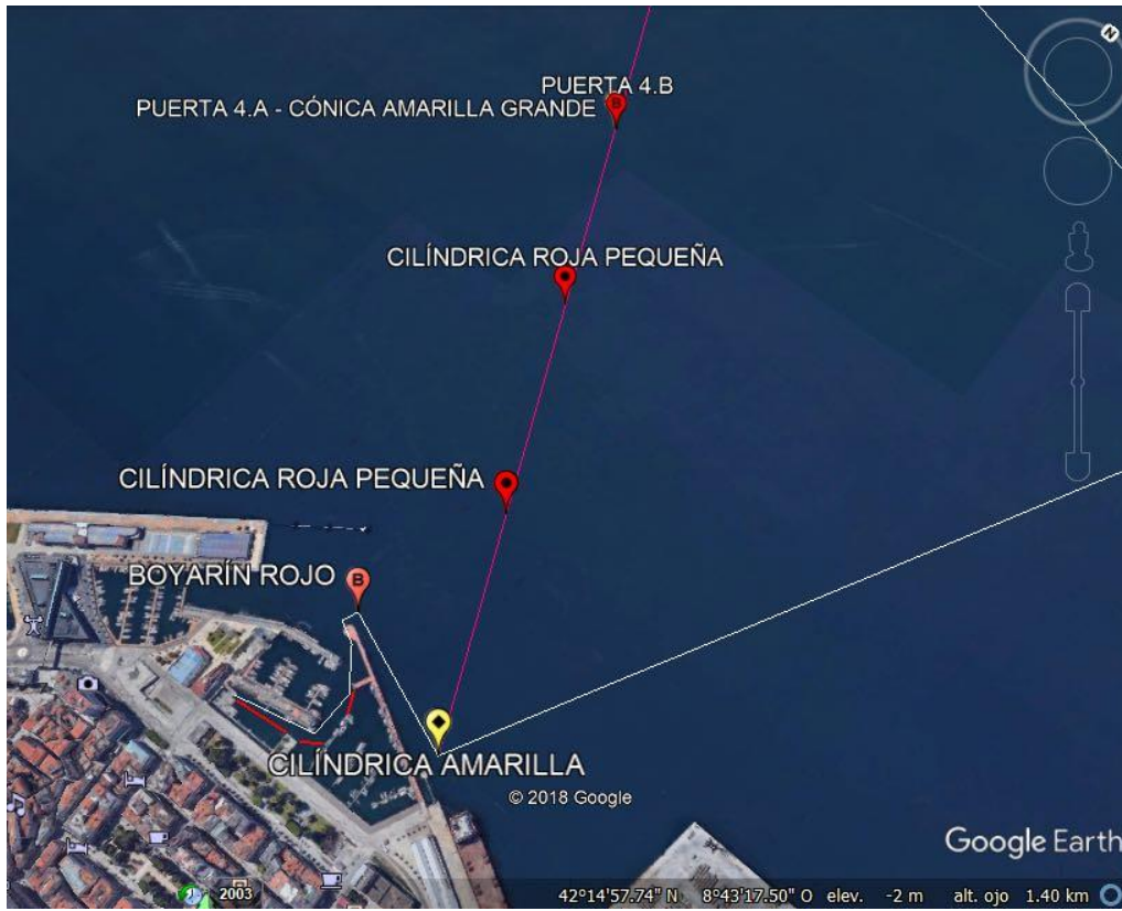
Tramo 3 Categoría 3