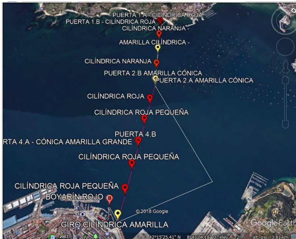
Recorrido completo Categoría 3