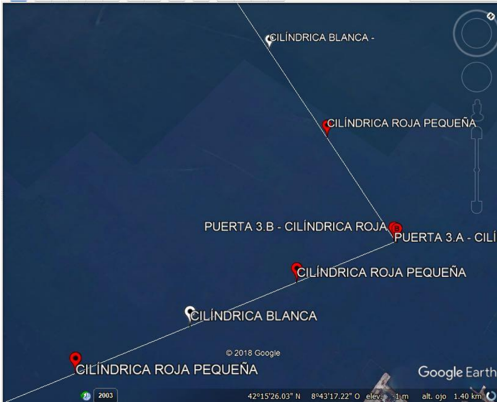
Tramo 3 Categorías 1 y 2