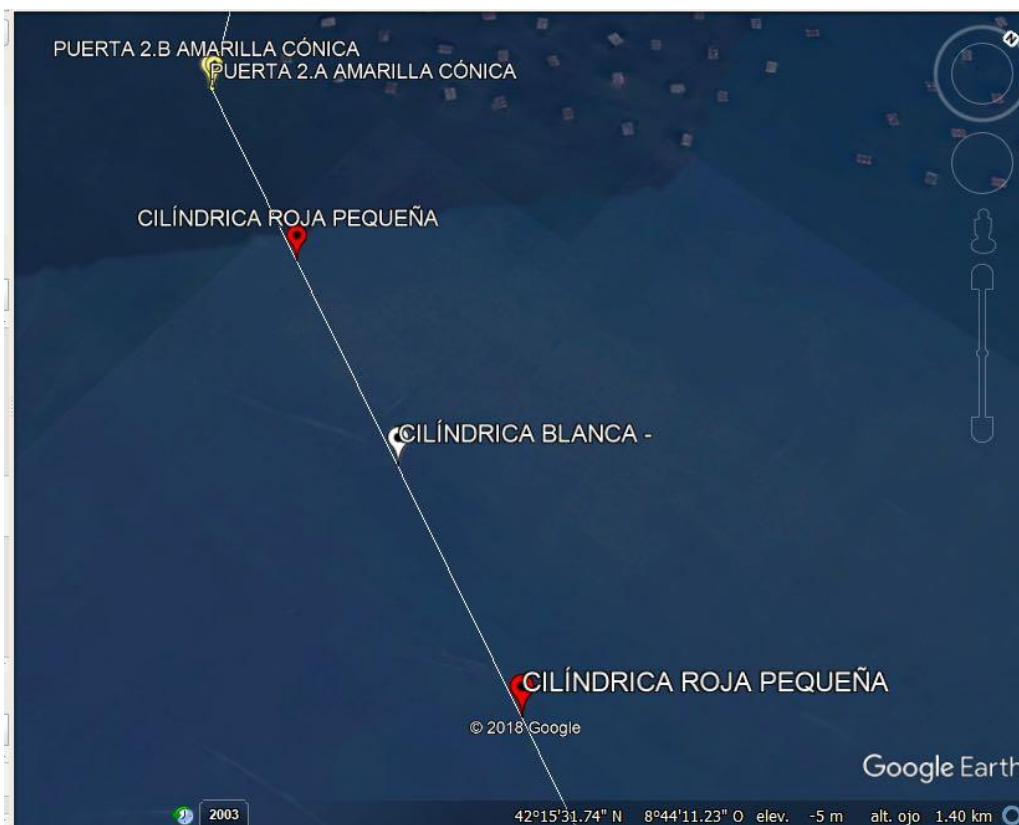
Tramo 2 categorías 1 y 2