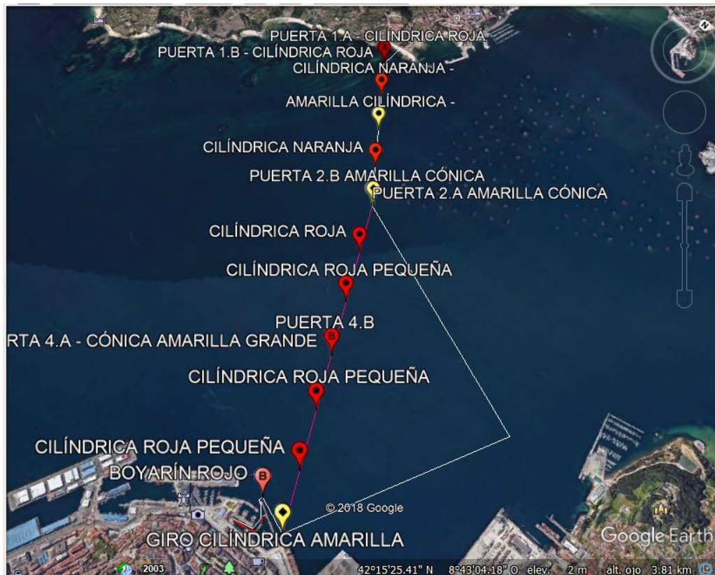
Recorrido completo Categoría 3