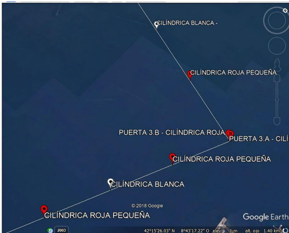
Tramo 3 Categorías 1 y 2