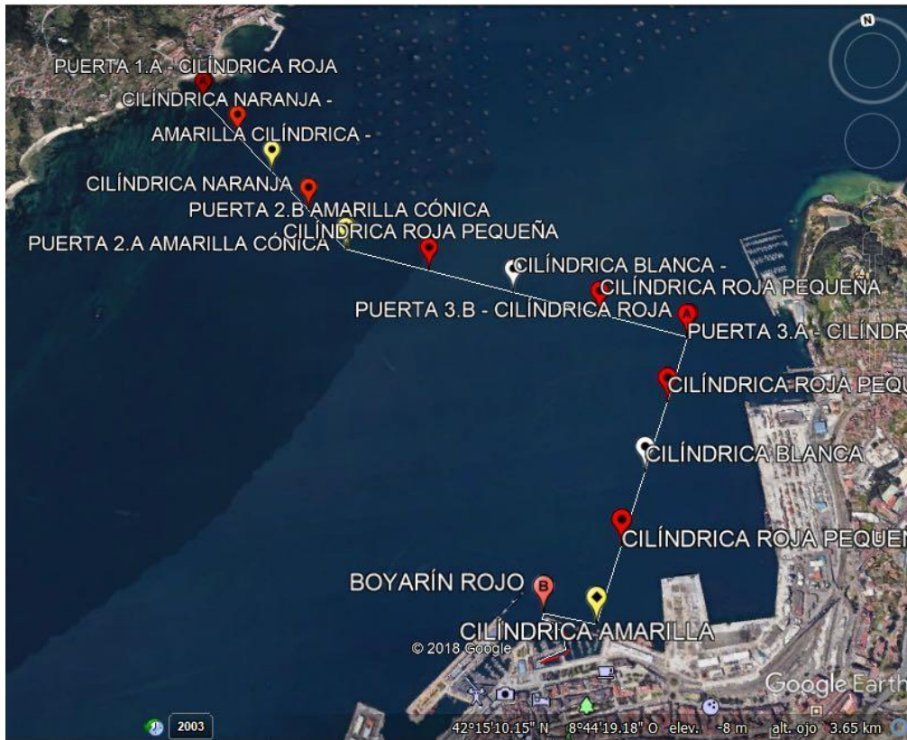
Recorrido completo categorías 1 y 2