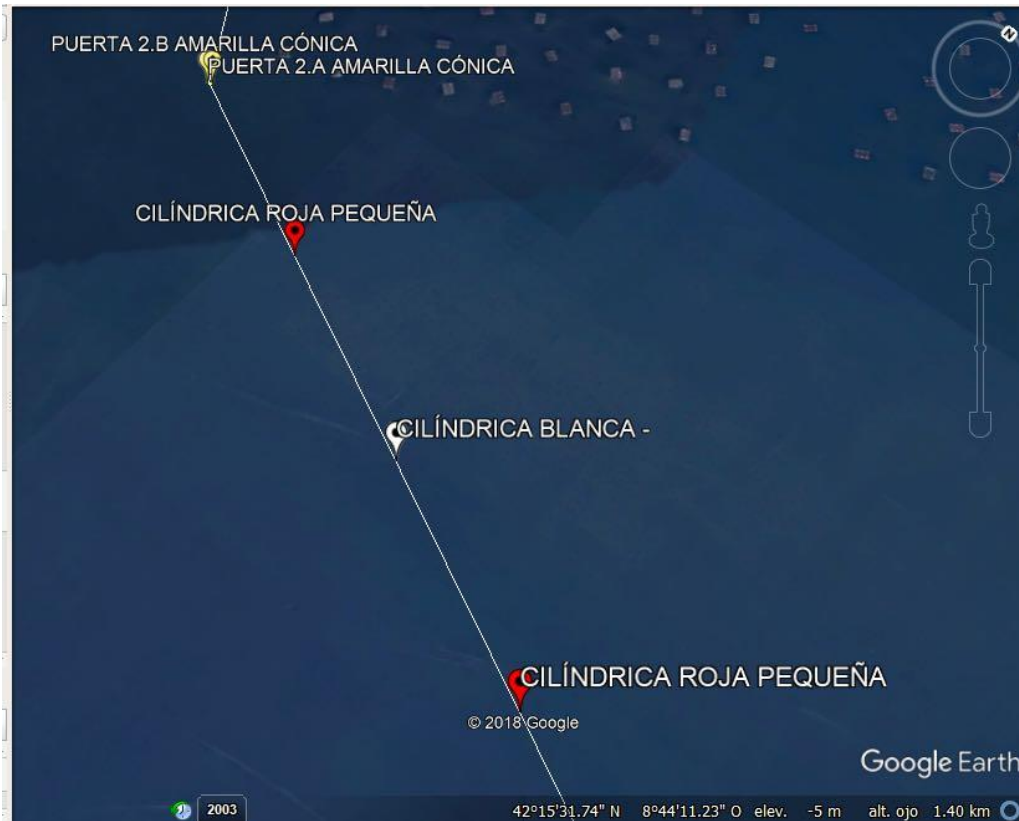
Tramo 2 categorías 1 y 2