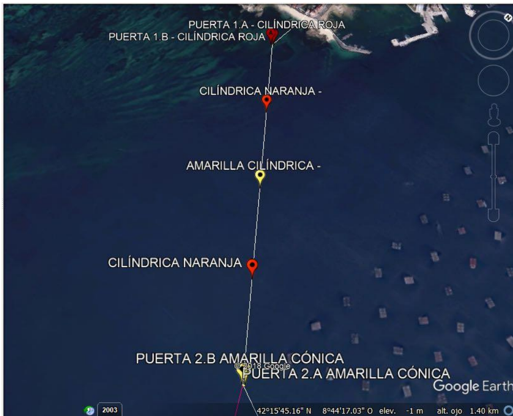
Tramo 1 común