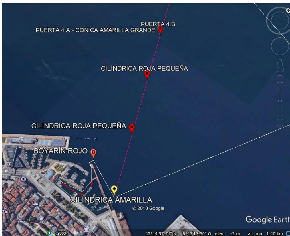
Tramo 3 Categoría 3