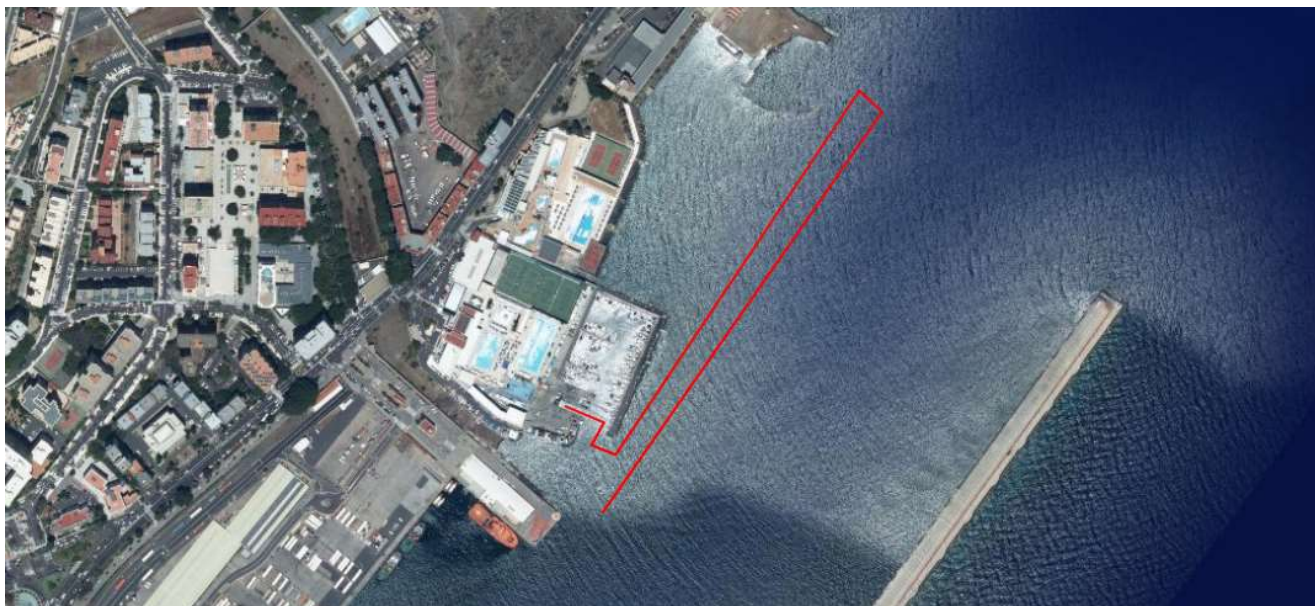
Imagen aproximada con el plano de situación de la salida de la prueba, boyas del recorrido, aproximadas, y llegada.

Distancia 3.000m. El comienzo de la prueba se hará a las 12:45h desde el Puerto deportivo del RCNT , los nadadores se dirigirán al agua, donde se realizará la salida para poder empezar a nadar. La prueba consistirá en una vuelta al circuito señalado, con llegada a meta situada en la rampa del varadero situado dentro del puerto deportivo del RCNT. Una embarcación abrirá la prueba y otra la cerrará. Se dirigirán en línea recta dirección “NE” , hacia Playa Valleseco, las boyas delimitación/orientación de las aguas del puerto rojas están dispuestas aproximadamente, cada 30 metros, y las boyas dispuestas por la organización más grandes, Rojas o Amarillas, que se encontraran cada 200 m aproximadamente, en la misma línea de recorrido, a la altura del Muelle de las Carboneras ( Valleseco ), se producirá en la el primer giro a la izquierda en la boya de referencia , dirigiéndose a la segunda boya situada a unos 50 m , donde giraran de nuevo a la izquierda , dirigiéndose en línea recta dirección “SO” hacia el RCNT, con llegada a meta situada en la rampa del varadero situado dentro del puerto deportivo del RCNT ,donde se encontrara situada la línea de META, dónde el cronochip detectará el tiempo de llegada.