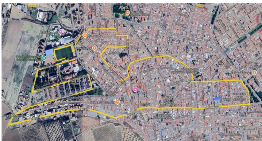
CARRERA D. 5KM