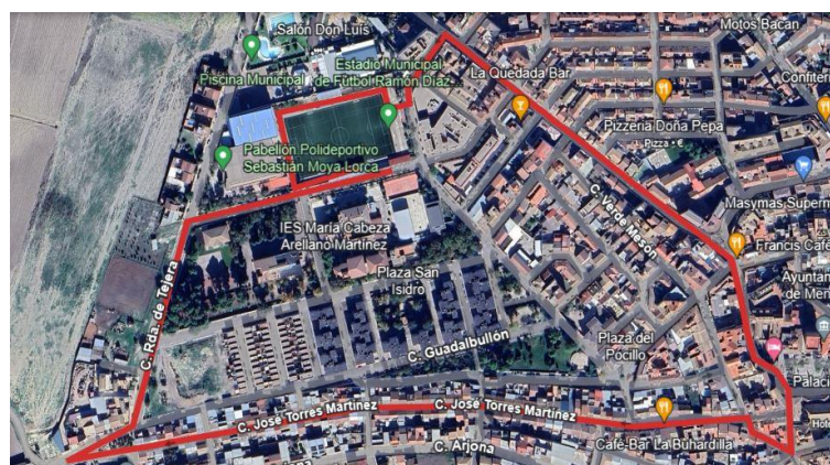
CARRERA C. 2.3KM