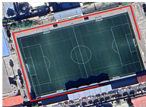
CARRERA A CHUPETE