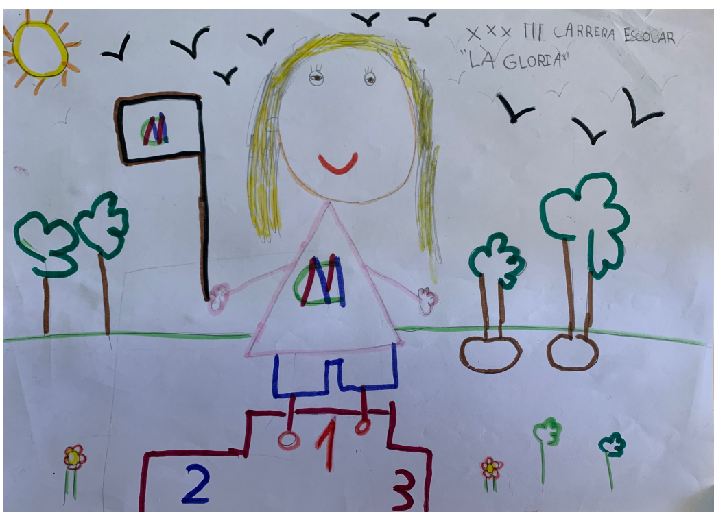
ROCÍO BALLESTEROS CARRASCO. 5 AÑOS A INFANTIL