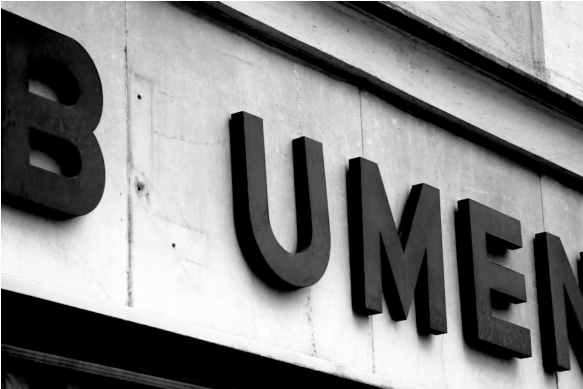
Flora Neuwirth, Archiv "clubblumen", 2009. Foto: Flora Neuwirth