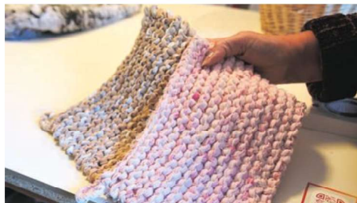
Grytlappar tillverkade av mattor.