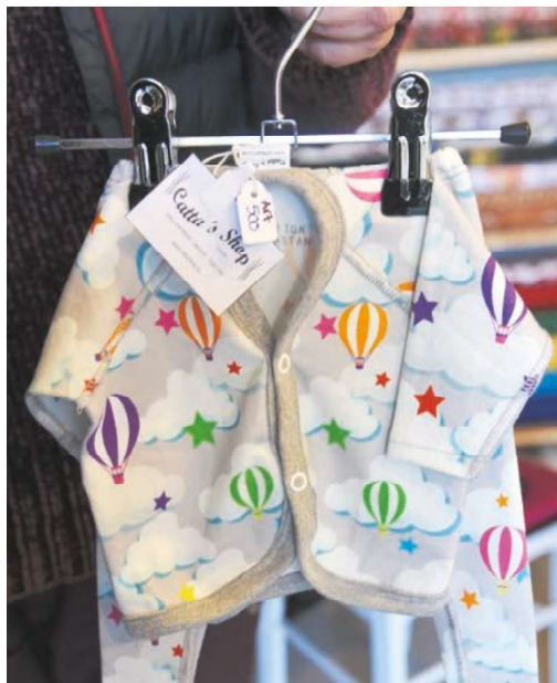
Chatrine syr bland annat prematurkläder.