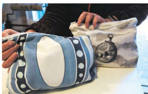
Necessärer av gamla gardiner.

flatlocksöm, som inte skaver, säger hon.