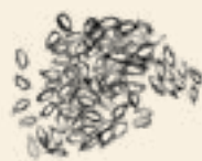
Brittiska kron linfrön