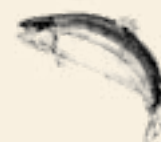
Lax från Skottland