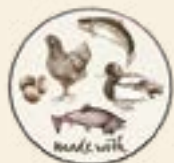
85% hävar 42% färskt