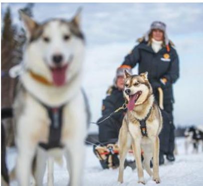
Slitte trainate dagli Husky