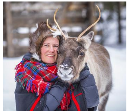
Renne nel ghiaccio Artico