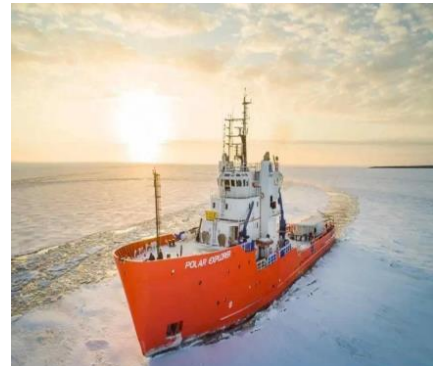
Rompighiaccio sull' Artico