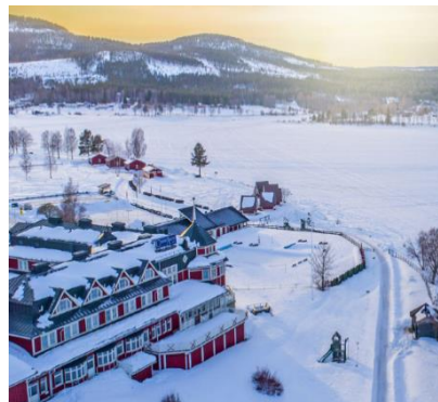
Grand Arctic Resort, Overkalix