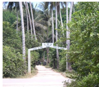
Parco Nazionale Jozani