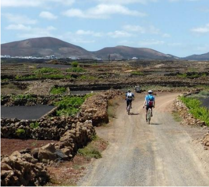
Paesaggio di Lanzarote