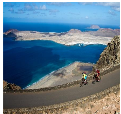
Pedalare con vista