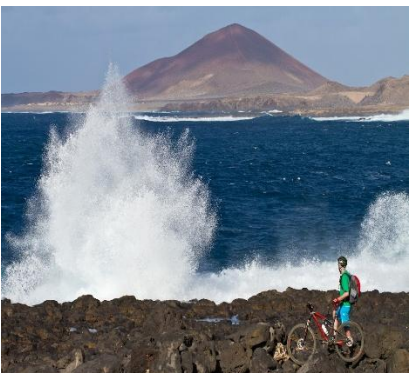
Bici & vulcani