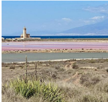
Saline di Cabo de Gata