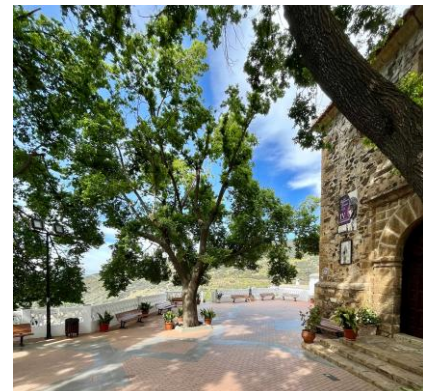
Bayarcal - Sierra Nevada