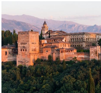
Alhambra - Granada