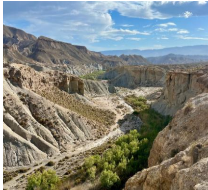
Deserto di Tabernas