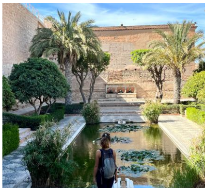
Aldabra di Almería

Granada ospiterà la parte finale del nostro viaggio. Sarà da questo versante che ci inoltreremo con una giornata di trekking tra ponti sospesi e sentieri nella maestosità di queste montagne, ammirando il profilo di alte cime... e il dischiudersi della sua flora ricca di endemismi. I motivi, le trame e i giardini de l'Alhambra chiuderanno questo viaggio, lasciandoci il sapore di un affaccio incantato su mondi e tempi diversi dal nostro.