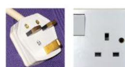
Presse tipo G