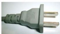
Presse tipo A