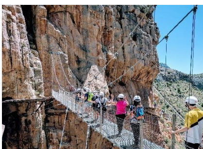
Caminito del Rey