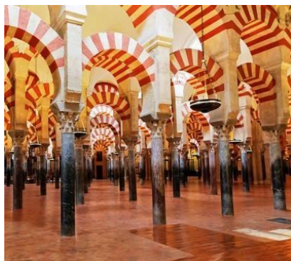
Cordoba - Mezquita