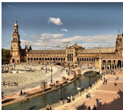
Plaza de España - Sevilla