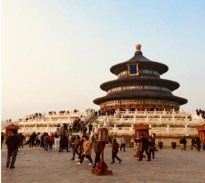
Tempio del cielo