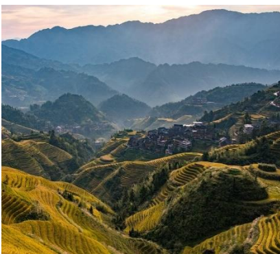
Terrazzamenti di Guilin