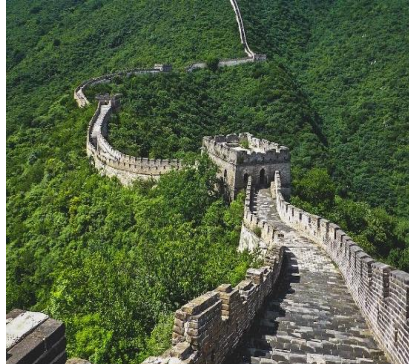
Grande Muraglia Mutianyu