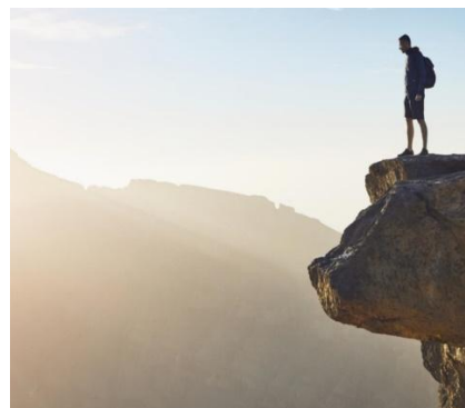
Wadi Helo, Watchtowers Trek