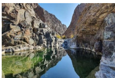
Wadi Showka, nelle montagne Hajar