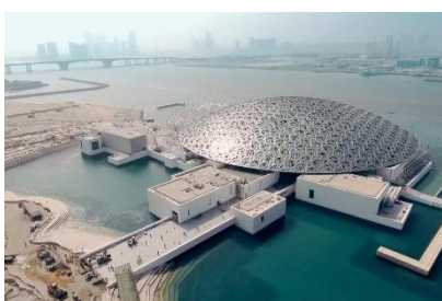
Museo Louvre di Abu Dhabi