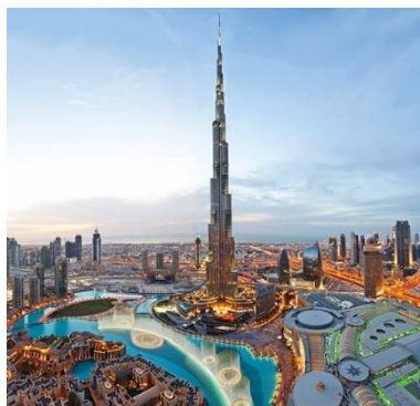
Burj Khalifa di Dubai