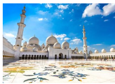
Sheikh Zayed Grand Mosque, Abu Dhabi

La maestosa e affascinante Grande Moschea dello Sceicco Zayed è tra le più grandi del mondo, e simboleggia l'esclusiva interazione tra l'Islam e le altre culture. Lo Sceicco Zayed bin Sultan Al Nahyan, Fondatore degli EAU, aveva in mente un obiettivo ben preciso per questa moschea: racchiudere i diversi stili architettonici delle diverse civiltà musulmane e celebrare la diversità culturale creando un luogo profondamente accogliente e di grande ispirazione che racchiudesse il messaggio di pace e di tolleranza veicolato dall'Islam, e accogliendo persone di ogni credo religioso.