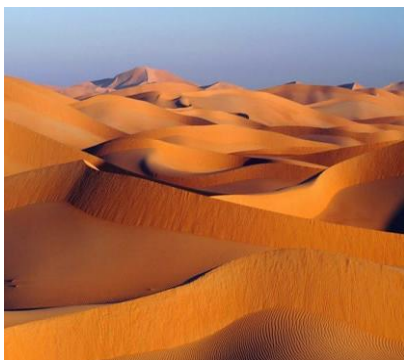
Dubai Desert Conservation Reserve