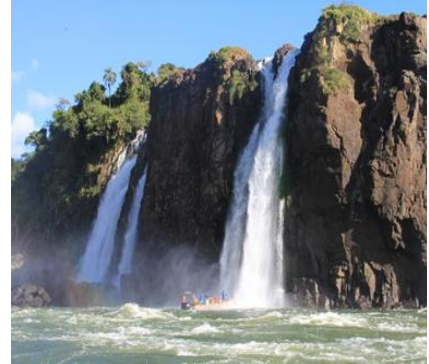
Le Cascate di Iguazu – Lato Argentino