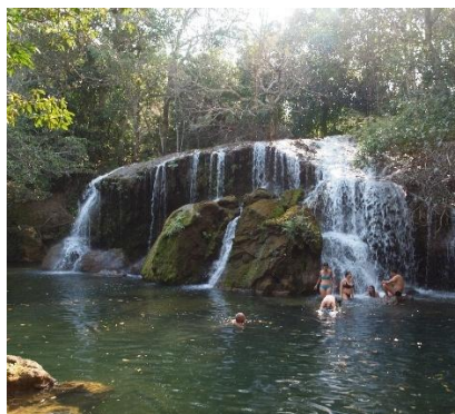
Bagni e snorkeling nei fiumi a Bonito