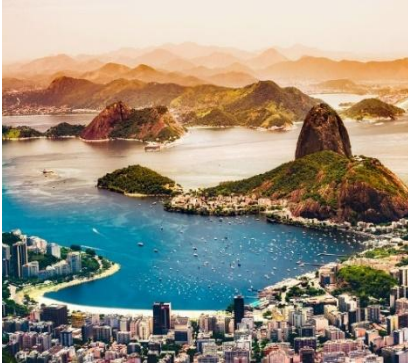
Panorama di Rio de Janeiro