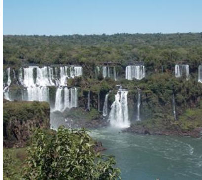
Le Cascate di Iguazu – Lato Brasiliano