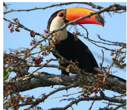
Tucano nel Pantanal