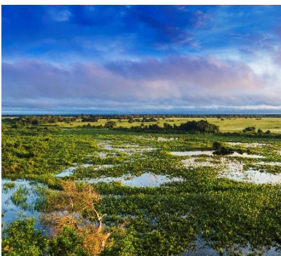
Panorama della regione del Pantanal