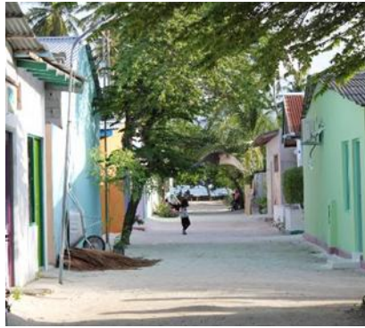
Isola di Felidhoo