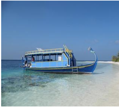
Isola di Ambara