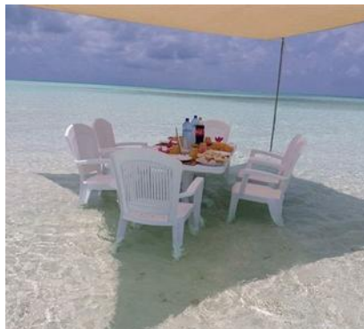
Pranzo alle Maldive