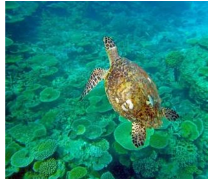
Snorkeling alle Maldive