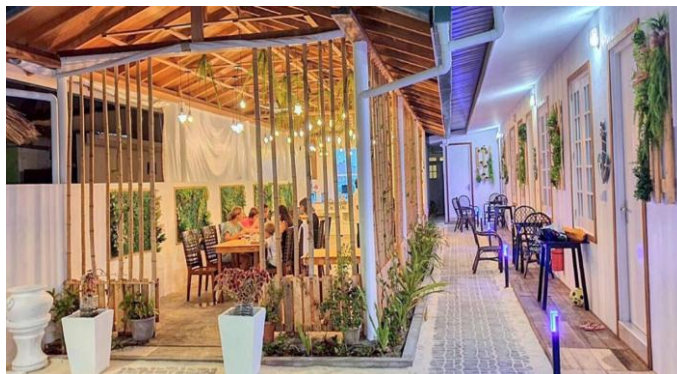
Tipica guest house maldiviana nell'isola di Keyodhoo

Utilizziamo una modalità di ospitalità tipica maldiviana, lontanissima dai resort all inclusive internazionali, quella delle guest house gestite direttamente dagli abitanti delle Maldive. Abbiamo scelto per il nostro soggiorno la piccola isola di Keyodhoo.