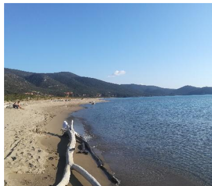
Spiaggia di Collelungo