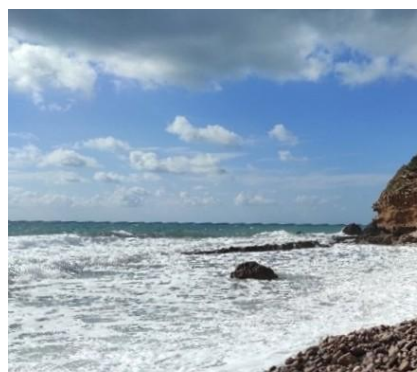
Cala di Salto del Cervo