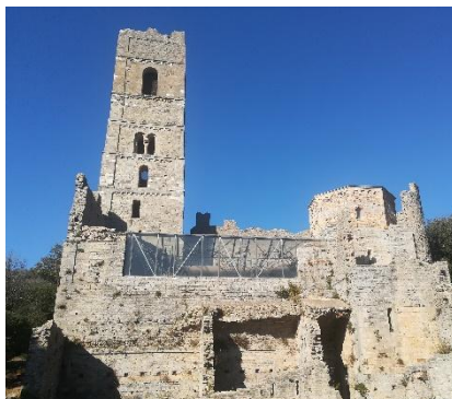
Abbazia di San Rabano