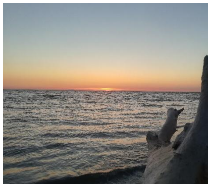
Tramonto sul Tirreno