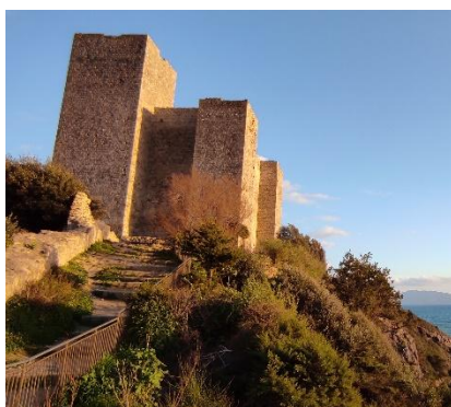
Fortezza di Talamone