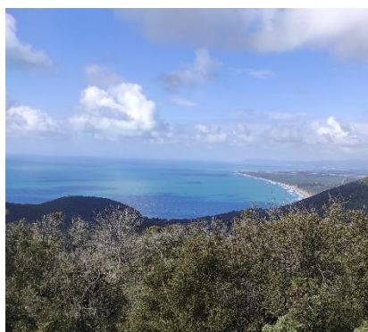
Panorama dal Poggio alle Sugherine