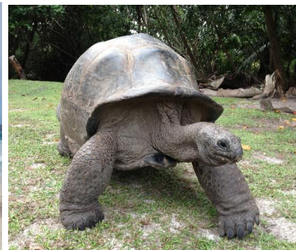
Tartaruga gigante a Curieuse