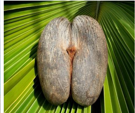
Coco de Mer