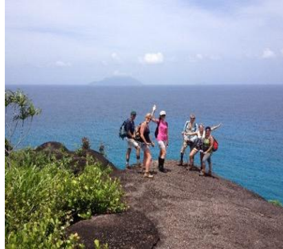
Trekking alle Seychelles