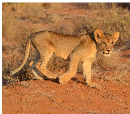
Safari fotografico ad Amboseli