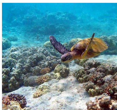
Malindi Marine National Park