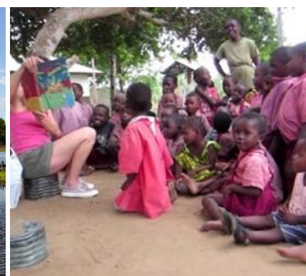
Solidarietà al Tabasamu Centre