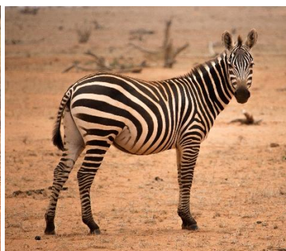
Safari fotografico a Tsavo Est e Ovest