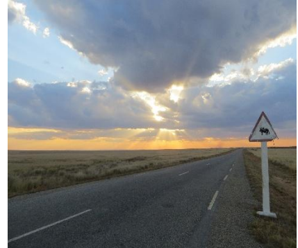
Le grandi pianure del Madagascar