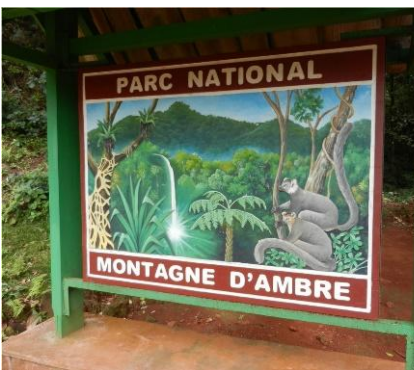
Parco Nazionale de La Montagne d'Ambre