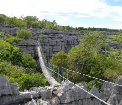
Parco di Ankarana Ovest