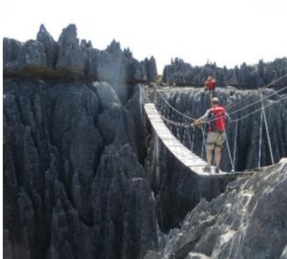
Tsingy di Bemahara