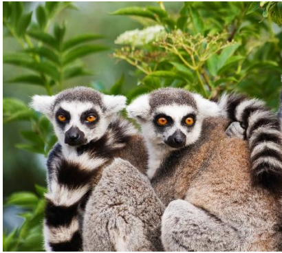
Incontro con i lemuri