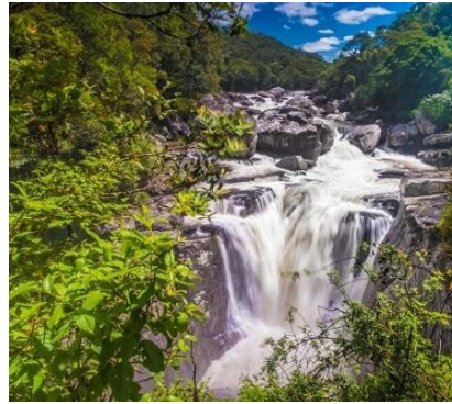
Ranomafana National Park