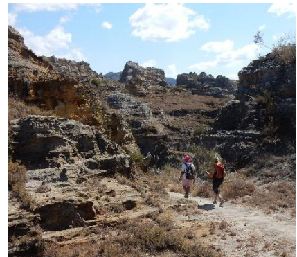
Isalo National Park

La fauna del Madagascar è caratterizzata da numerose specie endemiche, ma la più conosciuta è sicuramente il lemure. Si tratta di prossimie, un sottordine dei primati; ve ne sono 35 specie diverse e sono facilmente osservabili in natura nei tanti parchi naturali del Paese: si possono osservare il lemure catta, con la coda a strisce bianco nere, il lemure Indri, il più grande tra tutti con un muso da orsacchiotto e l'Aye Aye che passa la maggior parte del tempo in cima agli alberi per mangiare e godersi il sole. Questi piccoli animali vivono in genere in gruppi di 12-25 individui, in cui l'elemento dominante è sempre un esemplare femmina. I paesaggi naturali dell'isola sono unici e dissonanti: la densa foresta di tipo pluviale regala una lussureggiante vegetazione con grandi alberi, liane, piante medicinali, orchidee e la famosa Cananga odorata, comunemente conosciuta come ylang-ylang, dai cui fiori si ricava un'essenza profumatissima che impregna l'aria di tutto il Paese. In Madagascar vi sono due terzi delle specie esistenti di camaleonti, tra cui il Calumma Parsoni, l'esemplare più grande in assoluto e poi settanta specie di serpenti, anfibi, tartarughe e testuggini. Altri mammiferi sono il tenrec, la mangusta, il fossa e le balene, che si possono avvistare tra luglio e settembre al largo delle coste. Infine, nei bacini di acqua dolce vivono i coccodrilli, animali temibili, ma profondamente venerati dalla popolazione locale.