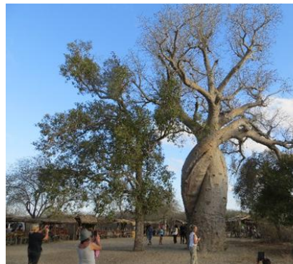
Famoso albero di Baobab intrecciato