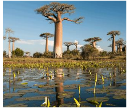
Alberi di Baobab