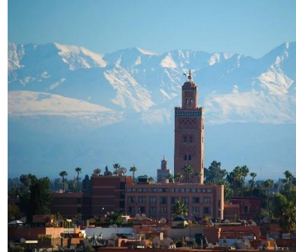
Città e montagne in Marocco