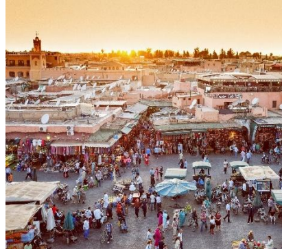
Piazza Djemaa El Fna - Marrakech