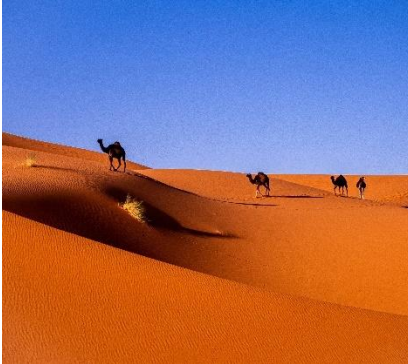
Deserto del Sahara