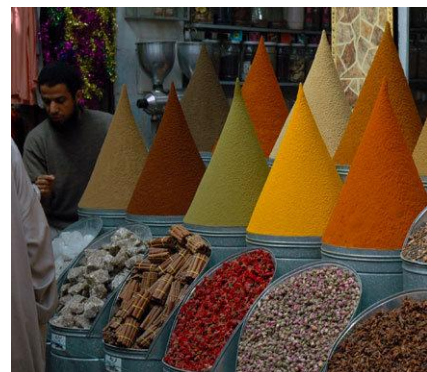
Mercato delle spezie