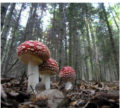
Parco Nazionale delle Foreste Casentinesi

Il parco ha al suo interno due luoghi straordinariamente importanti e affascinanti dal punto di vista spirituale e storico: l'Eremo di Camaldoli, fondato nel 1012 da San Romualdo, che scelse questo luogo splendido circondato da folte selve di abeti come luogo di ritiro e meditazione, riconoscendo alla cura del bosco un'importanza tale da divenire parte della regola dell'ordine; il Santuario della Verna, costruito sulla montagna che San Francesco ricevette in dono nel 1213 per farne un luogo di eremitaggio, che domina impressionanti strapiombi e balze rocciose da un lato e, dall'altro, è protetto dalla secolare selva di abeti e faggi conservata intatta per quasi otto secoli dai francescani. La presenza di queste comunità arricchisce indubbiamente il nostro parco, rendendolo unico nel panorama nazionale e testimoniando fisicamente come può l'uomo vivere in armonia con la natura.