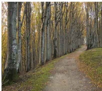
Parco Nazionale delle Foreste Casentinesi