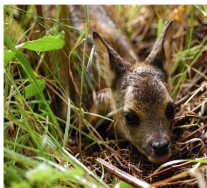
Cerbiatto all'interno del Parco