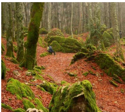
Parco Nazionale delle Foreste Casentinesi