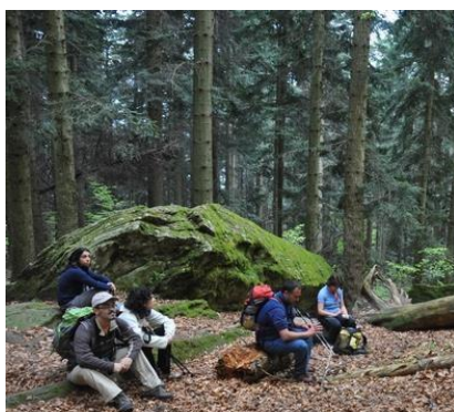
Momenti di relax durante un'escursione