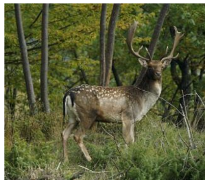
Un daino all'interno del Parco