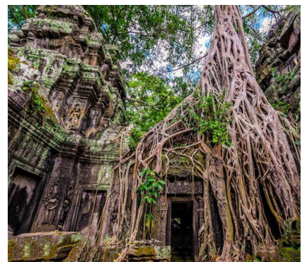
Ta Prohm, Templi di Angkor

Imperdibile in Cambogia: i Templi di Angkor! Anticamente in Cambogia esisteva uno degli imperi più forti e longevi dell'Asia sudorientale: era l'impero Khmer. La storia di questo regno è durata per oltre 600 anni, dal IX secolo al XV secolo. E quello che ci ha lasciato è qualcosa di straordinario: Angkor, un enorme sito archeologico che un tempo ne ha ospitato le varie capitali. Stiamo parlando di un'area di 400 km 2 che nel corso dei secoli si è estesa edificando numerosi edifici, tra i quali la miriade di templi che l'ha resa famosa.