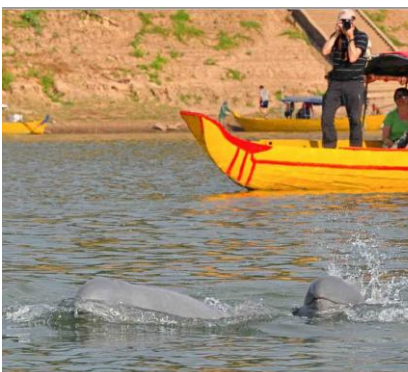
Alla ricerca dei delfini di fiume