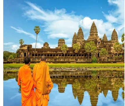
Angkor Wat, Cambogia