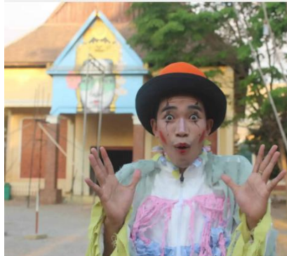
Il circo solidale