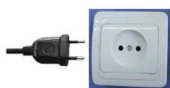
Presa tipo C

ELETTRICITÀ Voltaggio di 127/220V, 50 Hz. Le prese di corrente sono diverse da quelle italiane: sono presenti infatti prese elettriche di tipo A (americana a due poli), C (europea a due poli) e G (britannica a tre poli). È bene portare con sé un adattatore.