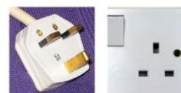
Presa tipo G

TELEFONO Prefisso internazionale per chiamare dall'Italia +855. Prefisso per chiamare l'Italia +39. Ampia copertura della rete GSM (cellulari) con possibilità di roaming internazionale.