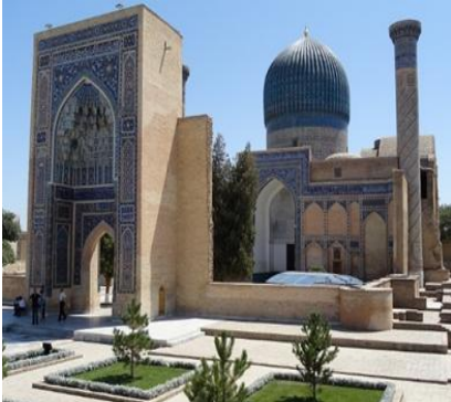
Mausoleo di Tamerlano - Samarcanda