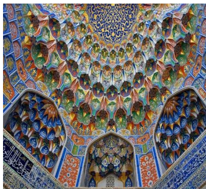
Abdul Aziz Khan Madrasah - Bukhara