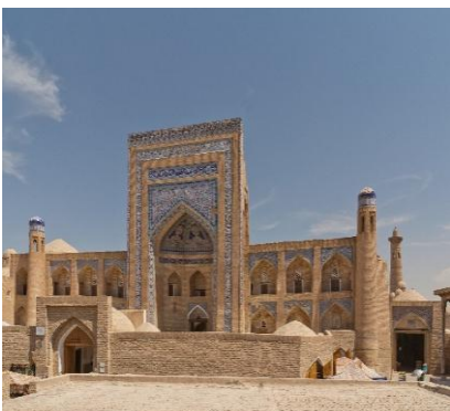
Madrasah - Khiva