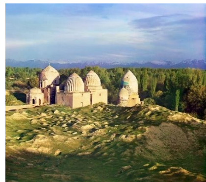
Moschea - Samarcanda