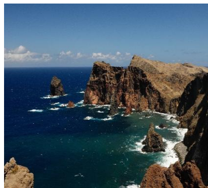
Punta Sao Lourenco