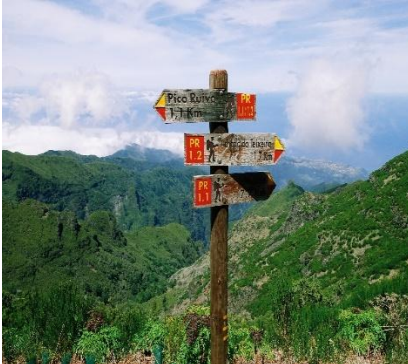
Panorama prima del Pico Ruivo