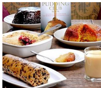
The Pudding Club

COTSWOLDS HILLS. I Cotswolds Hills sono la meta preferita dagli inglesi per staccare la spina, immergersi nella campagna con un'architettura tutt'altro che comune e assaporare la buona cucina. Dolci colline e vallate fluviali che si estendono per 160 chilometri nell'area centrale dell'Inghilterra delimitata a nord dal fiume Avon, a est dalla città di Oxford, a ovest da Cheltenham e a sud dalla valle del Tamigi. La maggior elevazione è Cleeve Hill di 330 metri di altezza. La parola "Cotswolds" deriva da due distinte parole dell'inglese arcaico: "wold", che indica una collina dal tratto gentile, e "cot", che significa recinto per le pecore. Ancora oggi, camminando tra gli incantevoli villaggi medioevali e le verdi colline si possono vedere i muretti in pietra che fungevano da recinzione quando nel passato quest'area era un importante polo del commercio laniero. È una terra incantevole ricca di alture boschive e un susseguirsi di gentili colline, corsi d'acqua e dolci pendii, dove pascolano migliaia di pecore ed è punteggiata da idilliaci villaggi e ricche cittadine, un tempo importanti centri per il commercio della lana fin dal medioevo. I ricchi mercanti lanieri hanno lasciato in eredità sontuose chiese, eleganti palazzi nelle città e residenze di campagna Manor House, tutte costruite con la pietra locale di color miele, che caratterizzano tutta la zona, e per lo più più mantenute nelle condizioni originali.