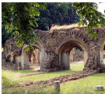
Abbazia Cistercense di Hailes