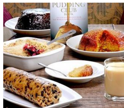
The Pudding Club

COTSWOLDS HILLS. I Cotswolds Hills sono la meta preferita dagli inglesi per staccare la spina, immergersi nella campagna con un'architettura tutt'altro che comune e assaporare la buona cucina. Dolci colline e vallate fluviali che si estendono per 160 chilometri nell'area centrale dell'Inghilterra delimitata a nord dal fiume Avon, a est dalla città di Oxford, a ovest da Cheltenham e a sud dalla valle del Tamigi. La maggior elevazione è Cleeve Hill di 330 metri di altezza. La parola "Cotswolds" deriva da due distinte parole dell'inglese arcaico: "wold", che indica una collina dal tratto gentile, e "cot", che significa recinto per le pecore. Ancora oggi, camminando tra gli incantevoli villaggi medioevali e le verdi colline si possono vedere i muretti in pietra che fungevano da recinzione quando nel passato quest'area era un importante polo del commercio laniero. È una terra incantevole ricca di alture boschive e un susseguirsi di gentili colline, corsi d'acqua e dolci pendii, dove pascolano migliaia di pecore ed è punteggiata da idilliaci villaggi e ricche cittadine, un tempo importanti centri per il commercio della lana fin dal medioevo. I ricchi mercanti lanieri hanno lasciato in eredità sontuose chiese, eleganti palazzi nelle città e residenze di campagna Manor House, tutte costruite con la pietra locale di color miele, che caratterizzano tutta la zona, e per lo più più mantenute nelle condizioni originali.