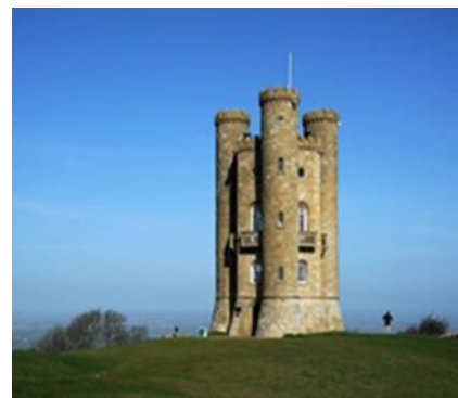
Torre di Broadway