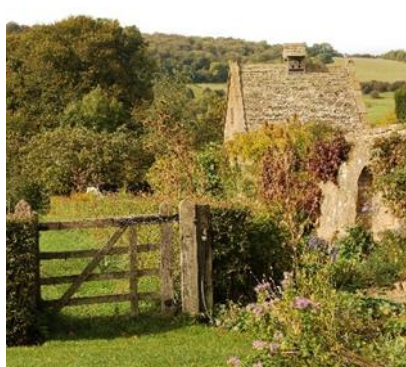
Snowshill Manor Garden