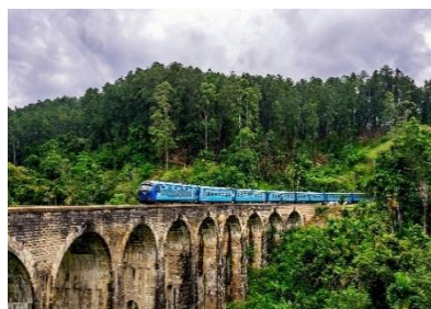
treno tipico srilankese