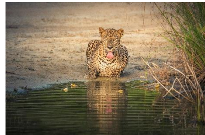
Leopardo nella giungla dello Sri Lanka