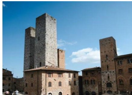
Torri di San Gimignano