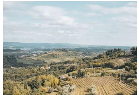
Colline San Gimignano

San Gimignano , nel Medioevo, avesse più di 70 torri: ogni famiglia nobile ne costruiva una sempre più alta per dimostrare il proprio potere. La rivalità era tale che il Comune dovette imporre un limite all'altezza... ma molti continuarono di nascosto. Le 13 torri rimaste sono quindi il risultato di orgoglio, competizione e un pizzico di disobbedienza.