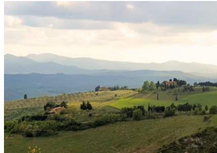
Colline di Volterra