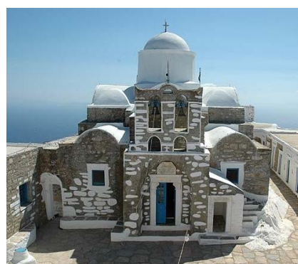
Monastero di Profitis Elisas

Dopo essere stata colonizzata da popolazioni di ceppo ionico, Sifnos divenne una piccola polis arricchendosi grazie alle miniere di elettro (lega naturale di oro e argento).