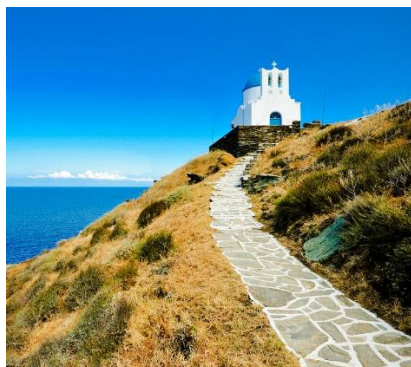
Chiesa Sette Martiri