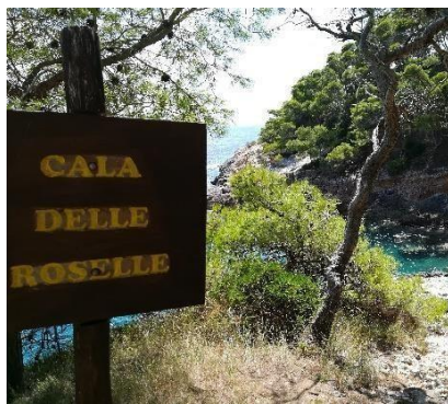
Cala delle Roselle