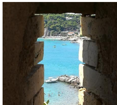
Scorcio da San Nicola