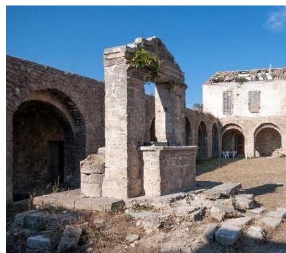
Santa Maria a Mare San Nicola

IL PARCO NAZIONALE DEL GARGANO E L'AREA MARINA PROTETTA. Il Parco Nazionale del Gargano è una realtà dalle mille sfaccettature. La linea costiera è un luogo straordinario per l'osservazione della natura. Qui, le variazioni ad opera di erosione, sedimentazione e cambiamento del livello marino, sono assai spettacolari e talvolta anche violente. Sia le scarpate delle falesie che le dune ospitano una flora ed una fauna molto caratteristiche con le quali è facile familiarizzare. Tra i punti salienti dell'analisi del paesaggio marino del Gargano, dobbiamo evidenziare che le coste adriatiche sono sottoposte a deboli variazioni del livello marino nonché i popolamenti animali o vegetali del litorale presentano un buon livello di elementi in comune. È importante ricordare che la scarsa ampiezza dell'escursione delle maree non ci permette di osservare la flora e la fauna marine. L'assenza di una zona di "oscillazione delle maree" limita le escursioni nel dominio marino, che è accessibile solo in immersione o durante escursioni di sea-watching.