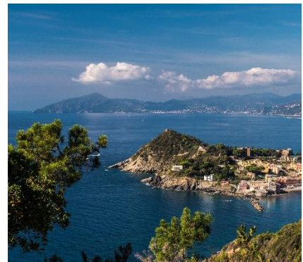
Vista su Sestri Levante