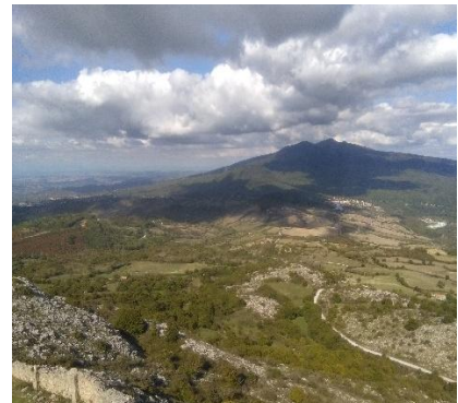
Il Monte Amiata