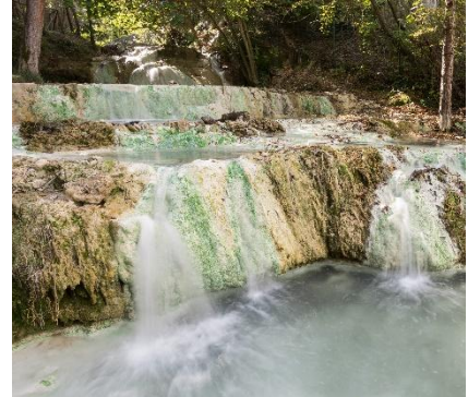
Bagni San Filippo