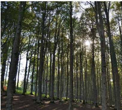
Faggeta sul Monte Amiata