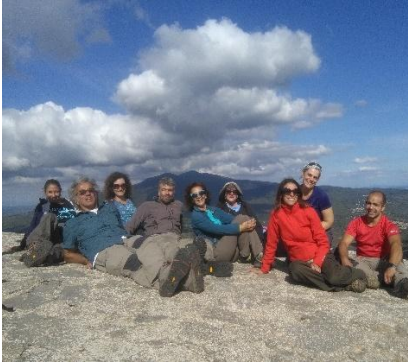
Sulla vetta del Monte Labbro