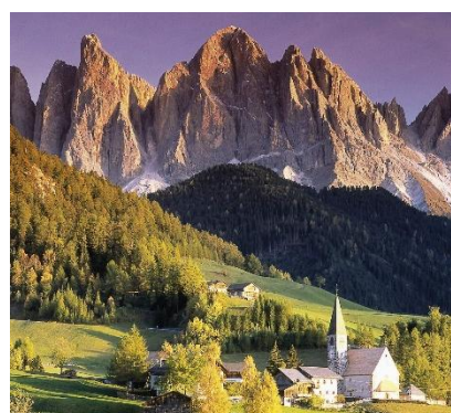
Santa Maddalena in Val di Funes