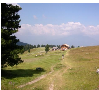
Verso la malga