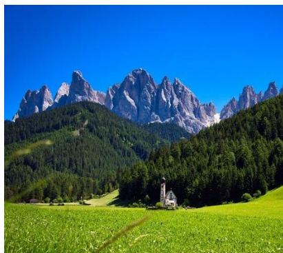
Panorama della Val di Funes