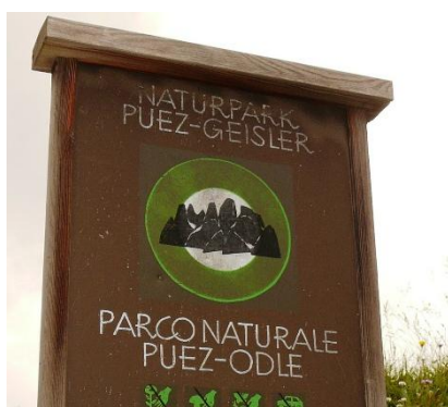
Parco Nazionale Puez Odle